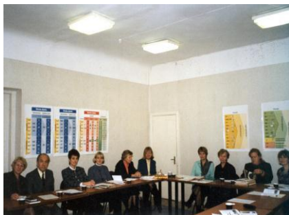
Pirmā valde – 1998. gada 22. decembris.