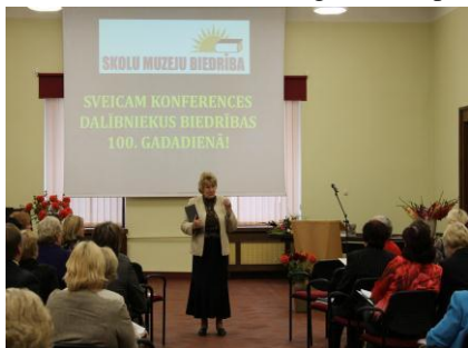
Konference – 2012. gada 29. septembris.