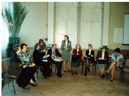
Pirmais seminārs – 2000. gada 24. aprīlis.