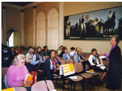
Pirmie kursi – 1999. gada 23. marts.